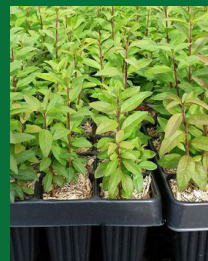
godets forestiers ou plein champ